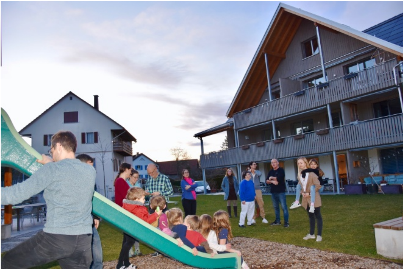
Das Open House in Pfäffikon ZH