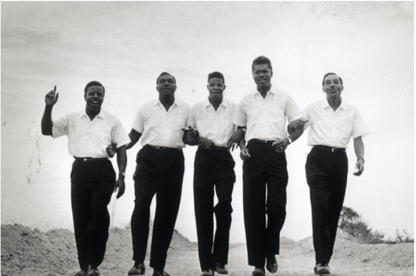
Die Gruppe «The Soul Stirrers»